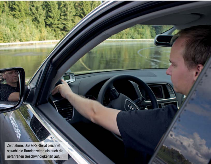
Zeitnahme: Das GPS-Gerät zeichnet sowohl die Rundenzeiten als auch die gefahrenen Geschwindigkeiten auf.

Wieder bilden Nokian, Dunlop, Pirelli und Conti die Spitzengruppe: Alle vier verlieren erst spät die Haftung. Der CrossContact UHP schiebt bei höherem Tempo noch am stärksten nach außen, Pirelli und Dunlop überzeugen mit ihrer direkten Reaktion auf Lenk-