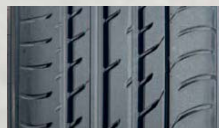
TOYO Proxes T1 Sport SUV