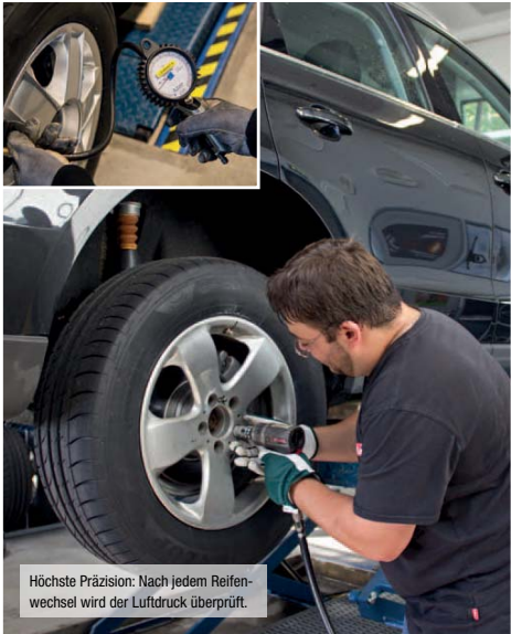
Höchste Präzision: Nach jedem Reifenwechsel wird der Luftdruck überprüft.

sind auf einem der Perfektion nahen Level unterwegs. Sie reagieren präzise auf Lenkbefehle, schieben bei hohem