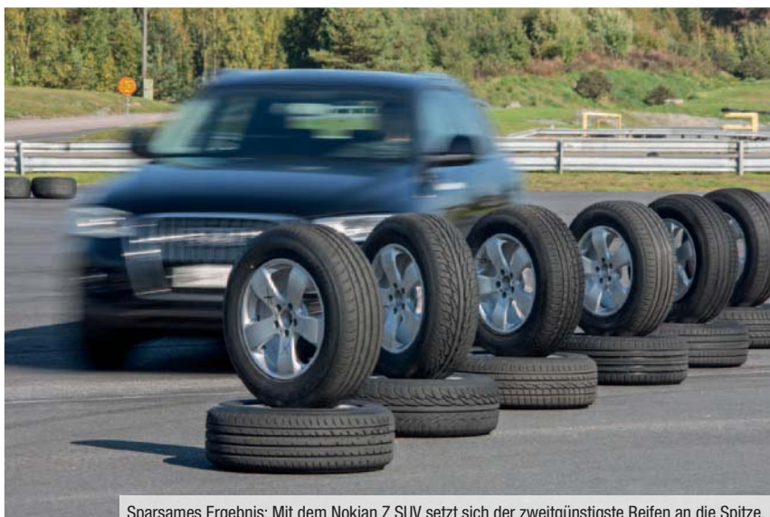
Sparsames Ergebnis: Mit dem Nokian Z SUV setzt sich der zweitgünstigste Reifen an die Spitze.

Wer im Sommer sicher unterwegs sein möchte, der hat bei der Reifenwahl viele Möglichkeiten. Mit Nokian, Pirelli, Dunlop und Continental bauen gleich vier namhafte Hersteller Pneus, die durch die Bank sehr gute bis gute Ergebnisse liefern. Die Unterschiede sind teilweise marginal. Durch sein ausgezeichnetes Handling landet der günstige Nokian Z SUV am Ende auf dem ersten Platz. Der vom Preis her vergleichbare Toyo kann da mit seinen nur durchschnittlichen Werten nicht mithalten – ein Testverlierer ist er mit seinem befriedigenden Endresultat deswegen aber noch lange nicht. Diesen Platz nimmt der Nankang ein: Auf trockenem Grund lässt er sich akzeptabel bewegen, bei der Geräuscentwicklung und dem Rollwiderstand spielt er sogar ganz vorne mit. Fängt es aber einmal zu regnen an, verlängert sich sein Bremsweg deutlich. In Kurven schiebt er über beide Achsen nach außen. Für uns ist er damit nicht mehr empfehlenswert.