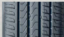
PIRELLI Scorpion Verde