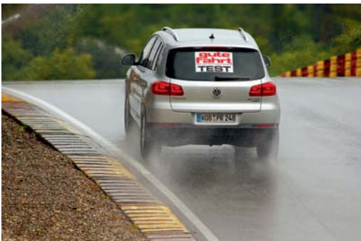
↑ Modernste Messelektronik zur Erfassung und Auswertung der Testergebnisse ← Eine steile Kuppe im Nasshandling-Parcours entlarvt Schwächen bei der Traktion

Zur Schlusswertung: Wie immer entfallen 25 Prozent auf das wichtige Nassbremsen, Nasshandling und Trockenbremsen gehen mit je 15 Prozent in die Endwertung ein. An Rollwiderstand und Trockenhandling gehen jeweils 10 Prozent, alle anderen Übungen haben einen Anteil am Gesamtkuchen von je 5 Prozent. Testsieger wird mit hauchdünnem Vorsprung vor Hankook, Pirelli und Dunlop der frisch überarbeitete Conti CrossContact UHP. Alle vier sind sehr gut und bekommen dafür die GF-Empfehlung. Aber auch Bridgestone, Goodyear und Toyo bauen wirklich gute Reifen, die man bedenkenlos empfehlen kann. Der günstige Westlake bestätigt dazu auch in diesem Jahr, dass aus China sehr wohl Reifen kommen können, die nicht so schlecht sind wie der Star Performer mit seinem viel zu langen und daher mangelhaften Nassbremsweg. Und wie lautet das Fazit zum Ganzjahresreifen von Vredestein? Der erledigt seine Aufgabe wie erhofft. Wer wenig fährt und das Wechseln von Sommer- auf Winterreifen vermeiden will, macht auch hier keinen großen Fehler. Doch ein Allwetterpneu ist und bleibt eben letztlich immer ein Kompromiss.